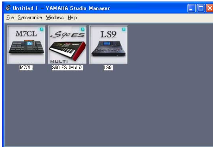
Fenster von Studio Manager

Doppelklicken Sie im Fenster von Studio Manager auf die Symbole der einzelnen Editoren.